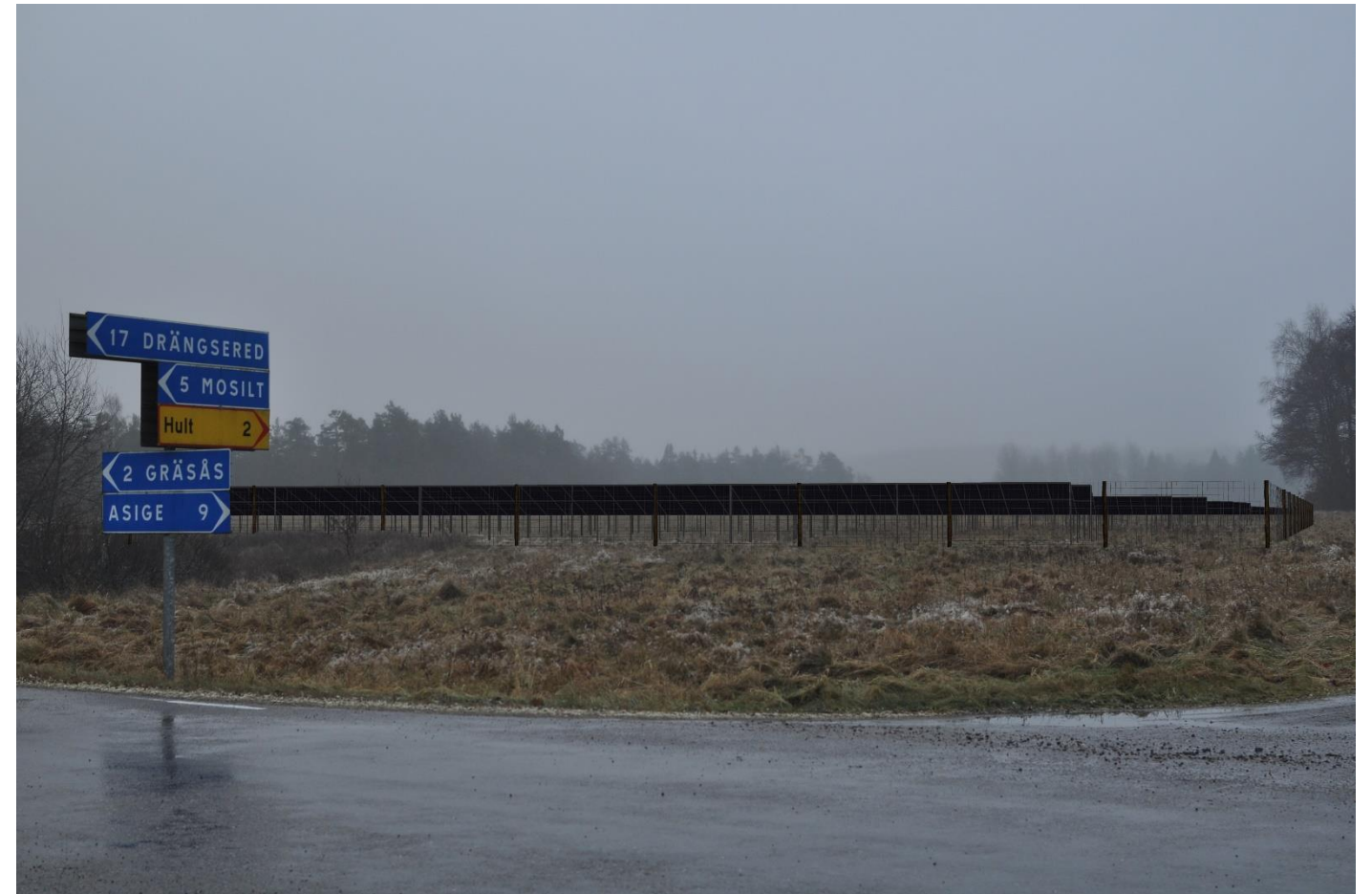
Figur 4. Solpark som omgärdas av staket.