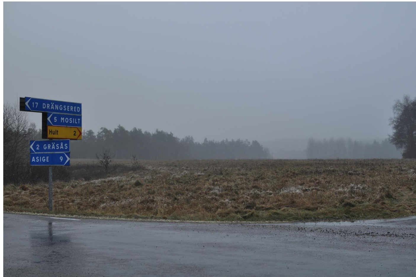
Figur 5. Nulägesbild av området.