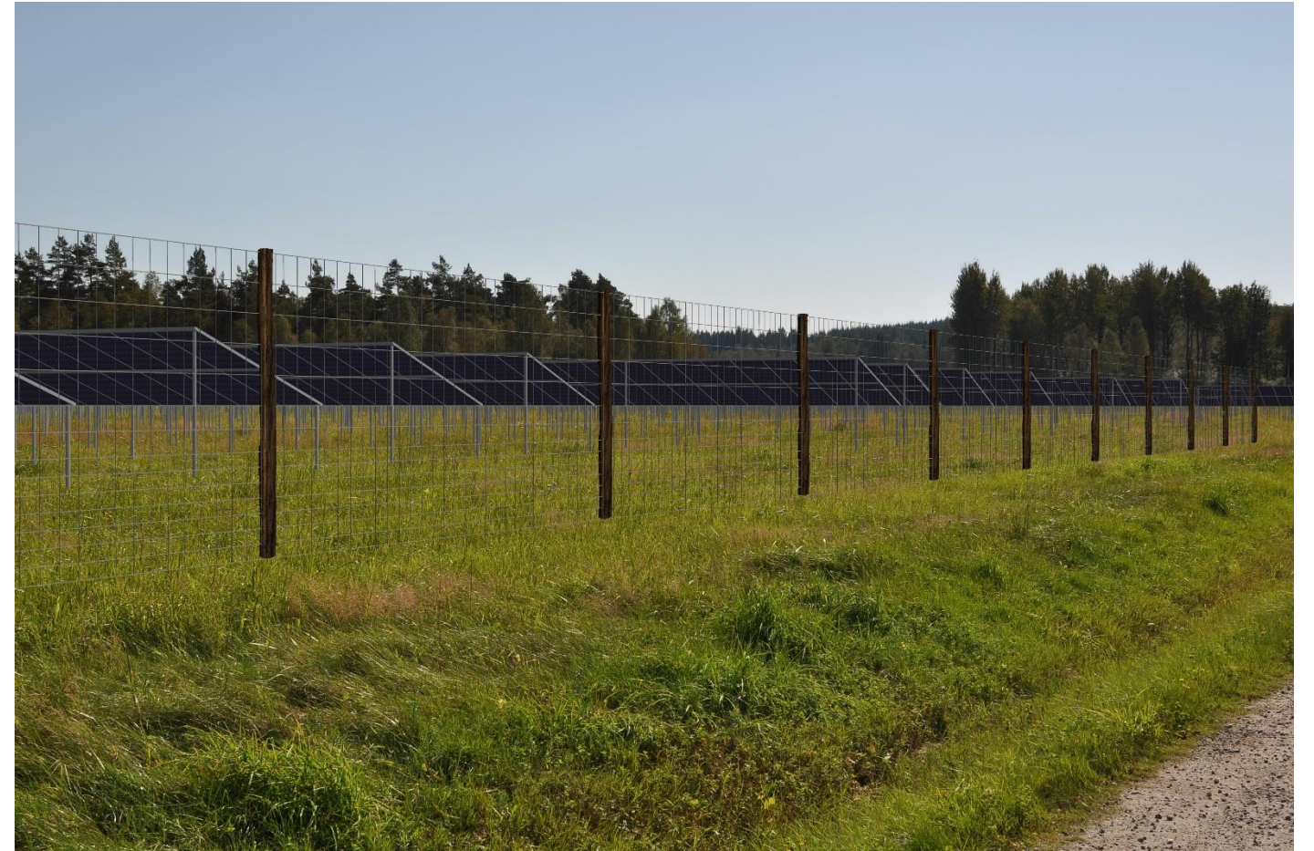
Figur 3. Solpark som omgärdas av staket.