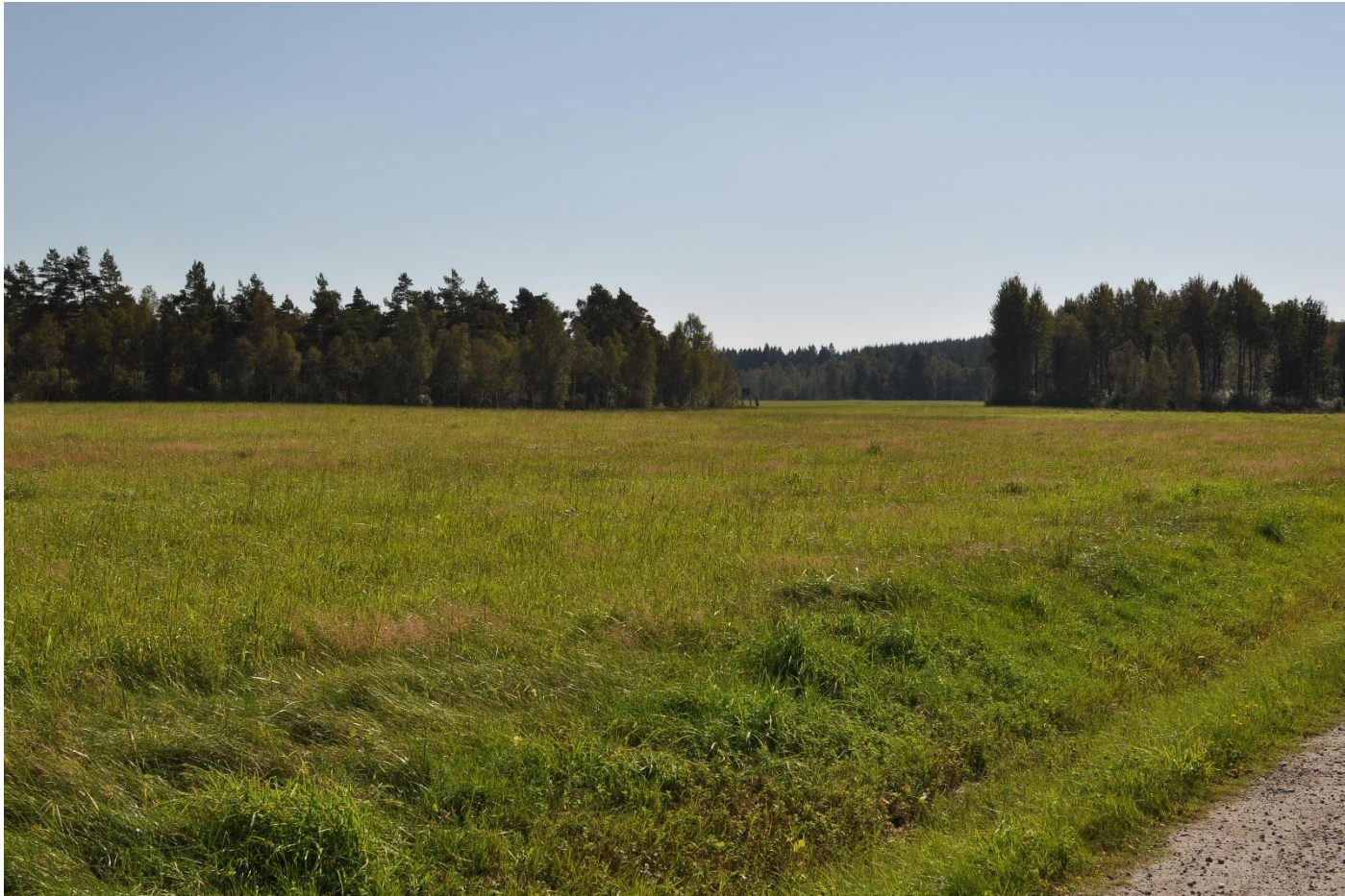
Figur 2. Nulägesbild av området.